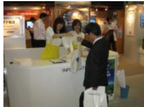
受付で記念品と資料を進呈