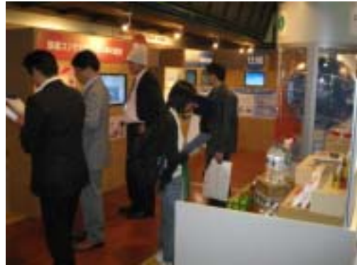
来場者がクイズ&アンケートに参加