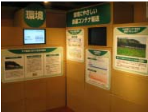
環境にやさしい鉄道コンテナ輸送コーナー