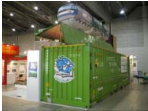
バルーンと31フィート・ウィングコンテナ