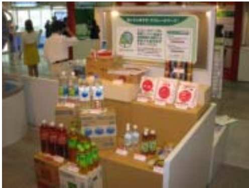
エコレールマーク認定商品の展示