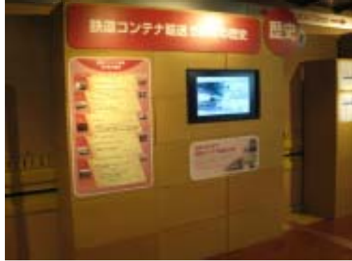
鉄道コンテナ輸送50年の歴史コーナー