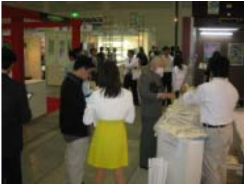
コンパニオンがクイズ&アンケート用紙を配布