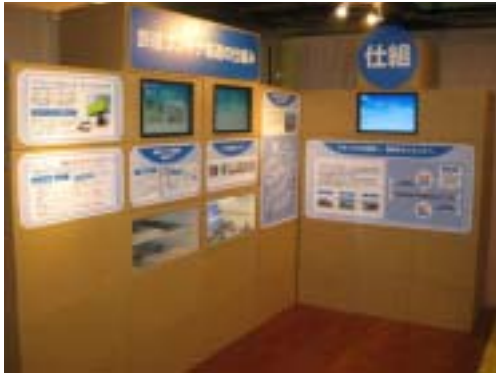
鉄道コンテナ輸送の仕組コーナー