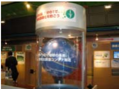
CO 2 排出量約7分の1オブジェ