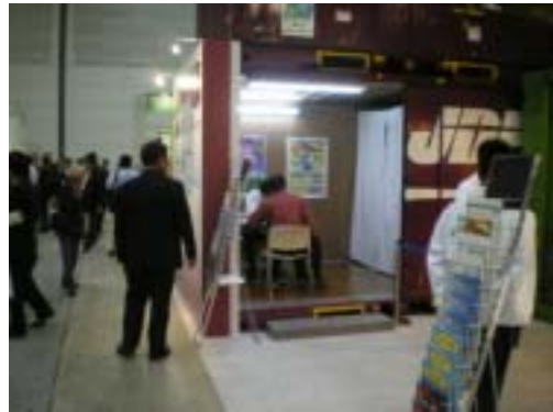
12フィートコンテナ内相談コーナー