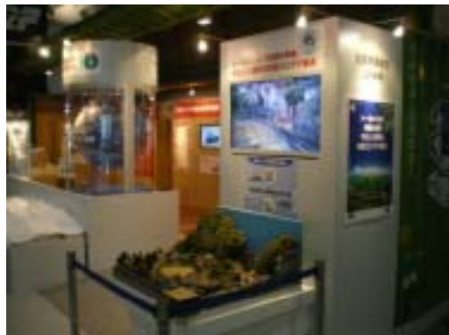
ジオラマ展示と映像放映