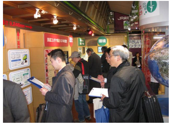
クイズの回答とアンケートを記入