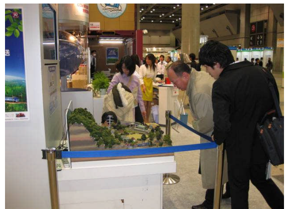
鉄道コンテナ輸送のジオラマ