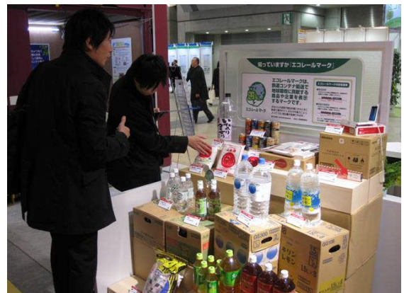
エコルールマーク認定商品