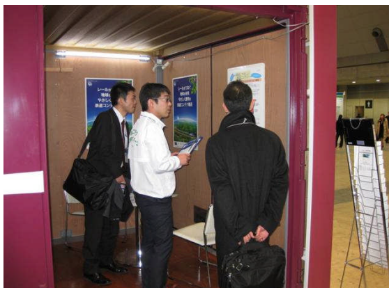
相談員が12ftコンテナを説明