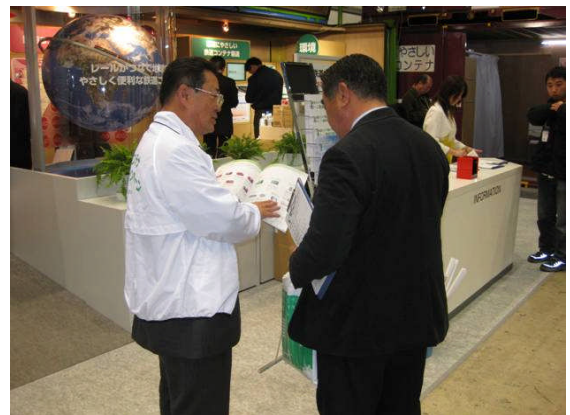
お客様の質問に応える相談員