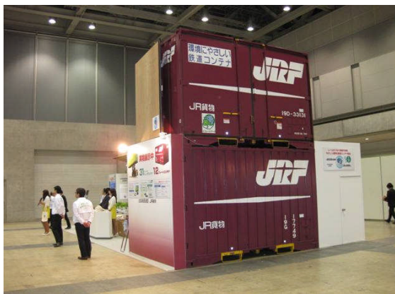
12フィートコンテナを2段積み