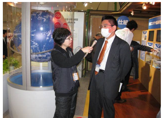
文化放送の取材を受ける