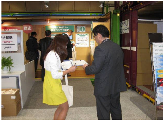
コンパニオンがアンケート用紙を配布